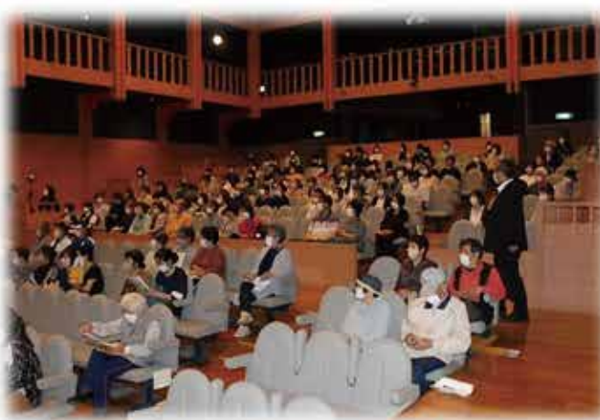
会場は熱心な聴講者でいっぱいになった

すると、本人は家族を大切に思っているから何も言えなくなる。自分も病気になるって申し訳ないって思うから、どんどん禁止されるとウツになり、生きる事をあきらめてしまう事につながる。 ③さらに問題は、皆さんの優しさ。認知症の人に失敗させないようにって先回りして何でもやってしまうと、本人がやれる事もやらなくさせてしまう。誰かに依存しなければ生きていけない。認知症よりの、対応で作り出されるウツや依存症、これが怖い。