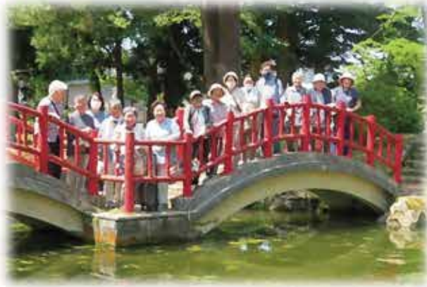
【中右】お茶会バス旅行 【下2枚】あやめ公園ドライブ&あやめ