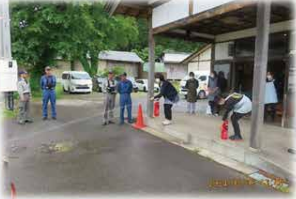
【上2枚】春の消防訓練 【中左】ミズの皮むき