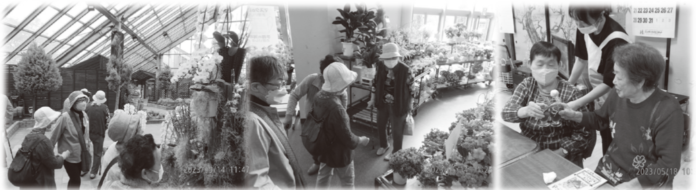
左&中：お茶会「日帰りバス旅行（秋田方面）」