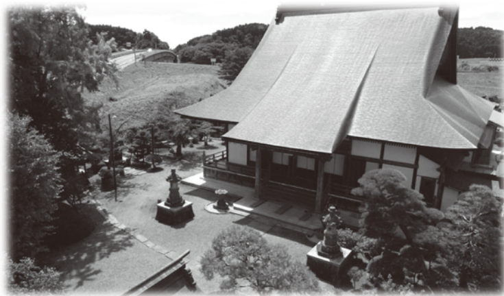
豊かな自然に囲まれる現在の「玉蓮寺本堂」

しかし、その矢先、明治29年、未曾有の三陸大海嘯が東北沿岸を襲います。東日本大震災にも匹敵する巨大な津波。約二十万人の死者。玉蓮寺と大淵の実家は、その被害を免れましたが、故郷の三陸の地は、一帯がすさまじい惨状となり