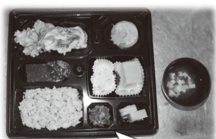
職員特製御齋『精進料理』