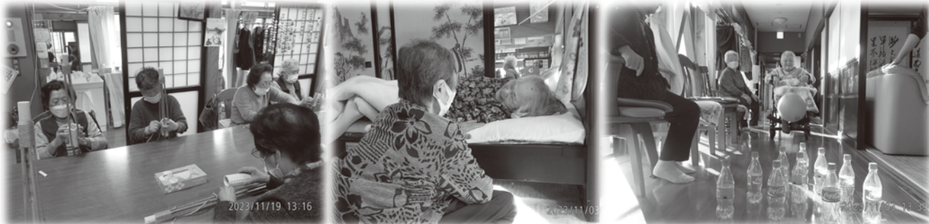
①『壁掛け飾り作り』 ②『お昼寝明けのひとコマ』 ③『通いサービスの様子』