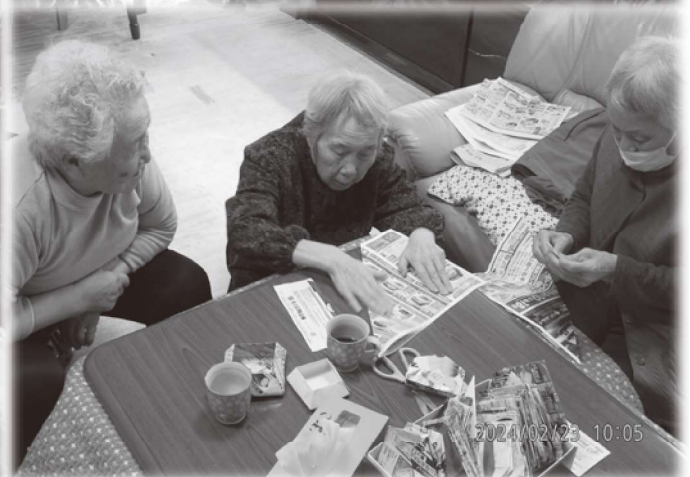
【上2枚+左下】お茶会「太巻き作り」